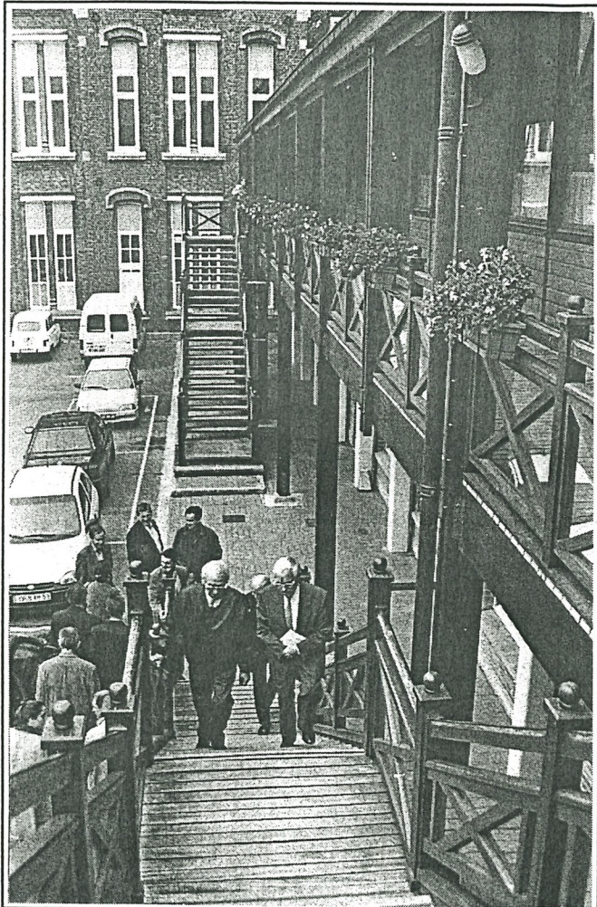
La visite commence. Une architecture agréable, façon centre de vacances, avec coursives et escaliers extérieurs.