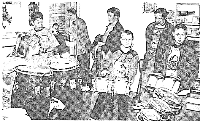
Les percussions donnent l'occasion de travailler l'expression.