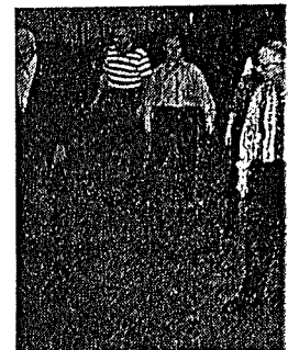
Chaque lundi, la salle des "jeunes années".