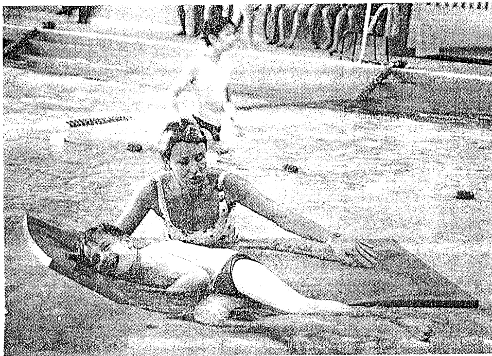
Faire découvrir le milieu aquatique aux enfants fait partie du travail éducatif du CMP.