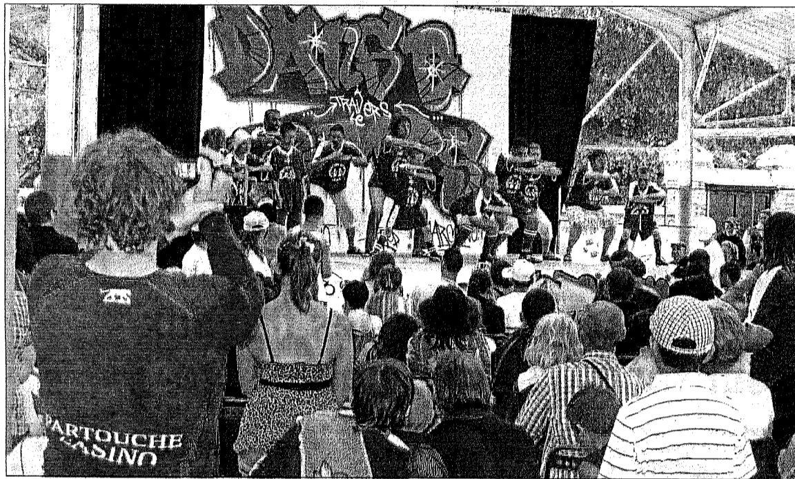
Pas de la danse très classique, mais des numéros souvent teintés d'humour.

Des enfants qui dansent en rythme, costumés, maquillés. Cela pourrait être une fête de fin d'année comme il y en a beaucoup en cette saison, si ces enfants n'étaient, justement, pas comme les autres. Ils sont suivis à Croix, à l'institut thérapeutique, éducatif et pédagogique.